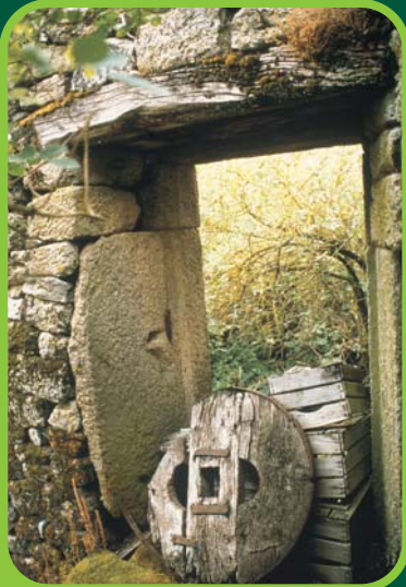
Foto: Puerta en Candado Chandrea de Queixa - Ourense.