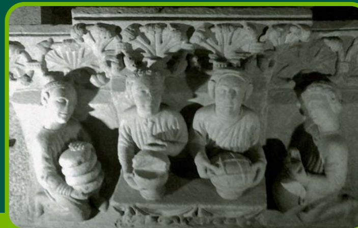
Pazo de Xelmírez