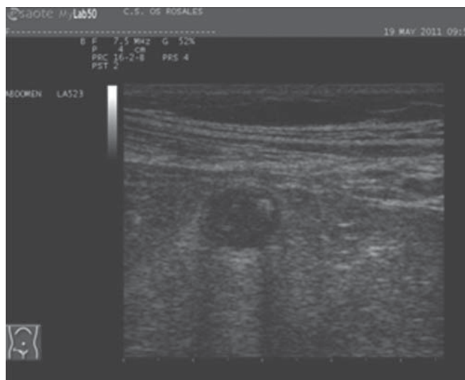
FIGURA 2: Eco