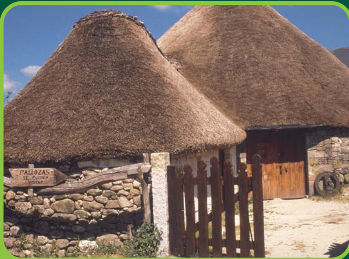
Foto: Pallozas en Piomedo. Cervantes - Lugo.